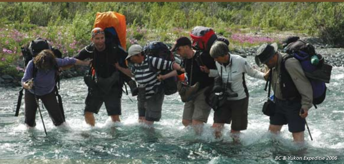
BC & Yukon Expeditie 2006

“Nature Trek Canada - Canada kenners die de tijd voor u nemen!”