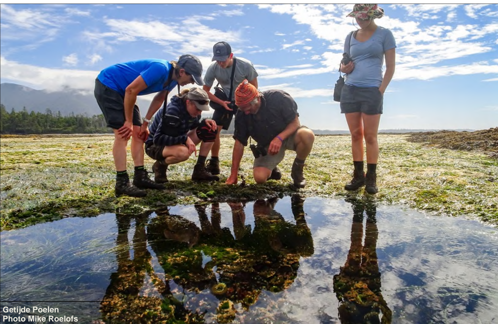
Getijde Poelen